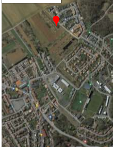
Zac de Cantebonne